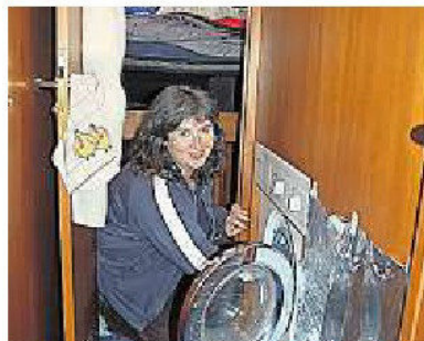
Jeder Zentimeter Platz ist genutzt: Vor der Schlafkoje tut die Waschmaschine Dienst.

Darunter ist auch ein Sponsor aus Hausen, der die Weltenbummler mit zirka 60 Kilo Schokolade versorgt hat.